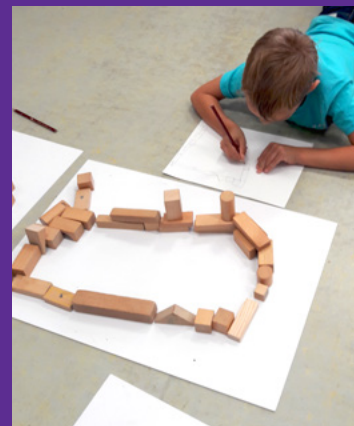
In de klas wordt een plattegrond gemaakt met behulp van blokken

De plattegrond van Den Bosch wordt bekeken in de groep. De kinderen zoeken waar ze wonen, wijzen elkaar aan en stellen vragen bij de diverse symbolen en afbeeldingen op de plattegrond. De plattegrond geeft aanleiding om te bespreken welke route de kinderen naar school volgen. Ze tekenen de looproute en maken hun eigen plattegrond van de omgeving van de school.