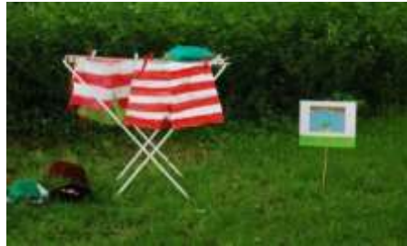
Ik ga naar het feest van Kikker en doe mijn Kikkerbroek aan

Iedereen doet mee! Ook de baby's vieren Kikkerfeest