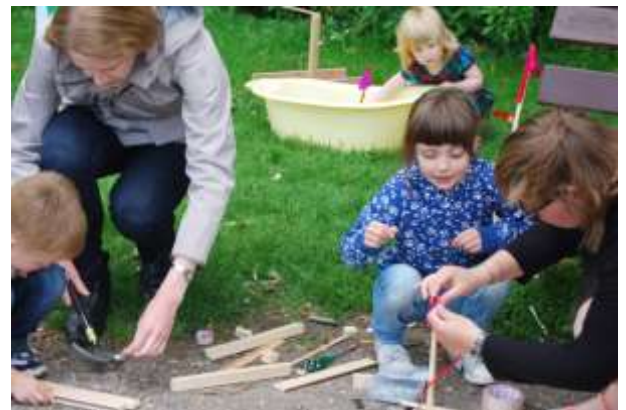
Wij maken een boot voor Kikker.... Hij blijft drijven!