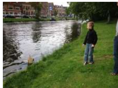
Wij willen meer weten over Kikker. Wij onderzoeken kikkervisjes. Huh...,ze kriebelen als je ze op je hand legt.